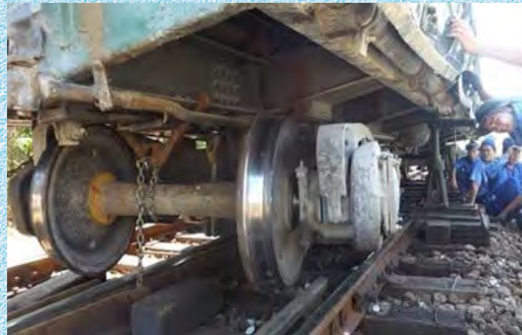
Tàu bị trật bánh khỏi đường ray

- Trưởng tàu tổ chức phân công nhân viên đường sắt và người có mặt tại nơi xảy ra tai nạn cứu giúp người bị nạn, bảo vệ tài sản của Nhà nước và của người bị nạn, đồng thời phải báo ngay cho tổ chức điều hành giao thông đường sắt hoặc ga đường sắt gần nhất.